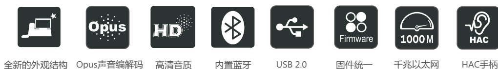
全新的外观结构 Opus声音编解码 高清音质 内置蓝牙 USB 2.0 固件统一 千兆以太网 HAC手柄

亿联SIP-T52S全面提升了话机的硬件配置，声音品质，用户体验，协作效率等，是一款高性价比的优质彩屏商务多媒体IP电话。