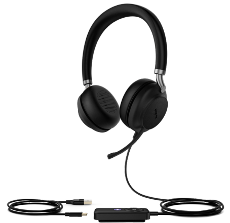
UH38 Dual Teams-BAT UH38 Dual UC-BAT