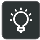
360 度可见的 Busylight