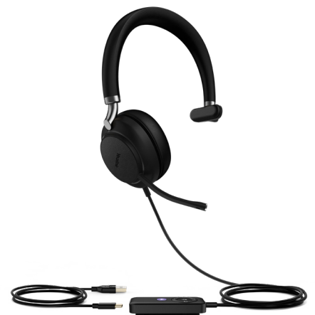
UH38 Mono Teams-W/O BAT UH38 Mono UC-W/O BAT

恍如无物的亲肤材质，柔软的记忆耳棉，结合符合人体工程学的贴耳式设计，为您带来全天的舒适体验，更轻松的掌握办公的优雅姿态。